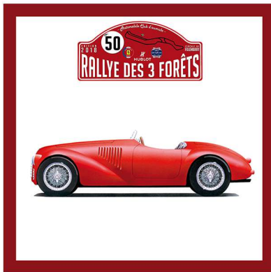
1947 - FERRARI 125 S