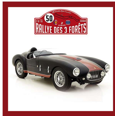
1953 - FERRARI 166 MM53 OBLIN