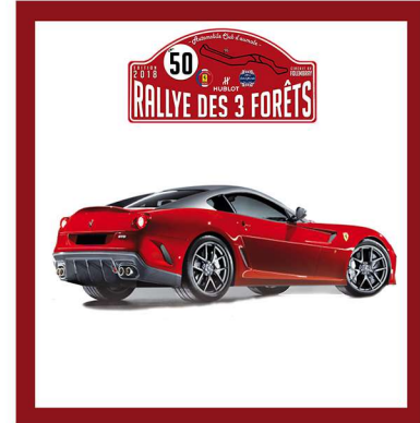
2010 - FERRARI 599 GTO

Précision: Il n'était pas nécessaire d'avoir la réponse à la lettre près pour gagner la totalité des points.