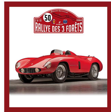
1954 - FERRARI 750 MONZA